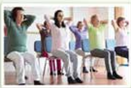
YOGA SUR CHAISE Les mardis de 13h30 à 14h30

Session automne 2019 Les Cèdres, Pavillon des Bénévoles