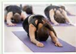
HATHA YOGA DOUX Les mercredis de 19h00 à 20h00

Session de 12 semaines / Débutant le 10 septembre 2019 Coûts : 150$/session