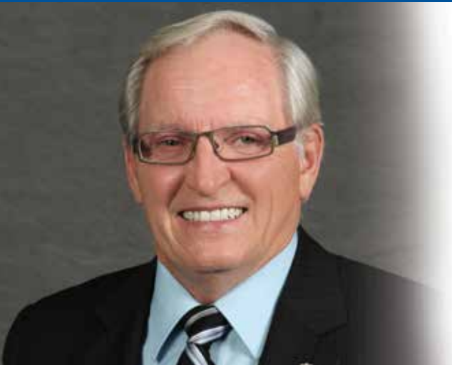
RAYMOND LAROUCHE MAIRE