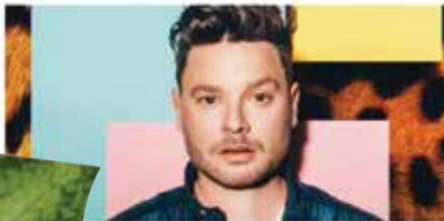
MERCI À NOS PRÉCIEUX PARTENAIRES